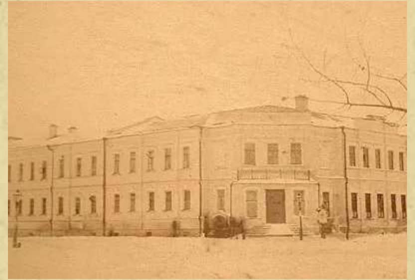
Хусан семинарийен сурчѣ