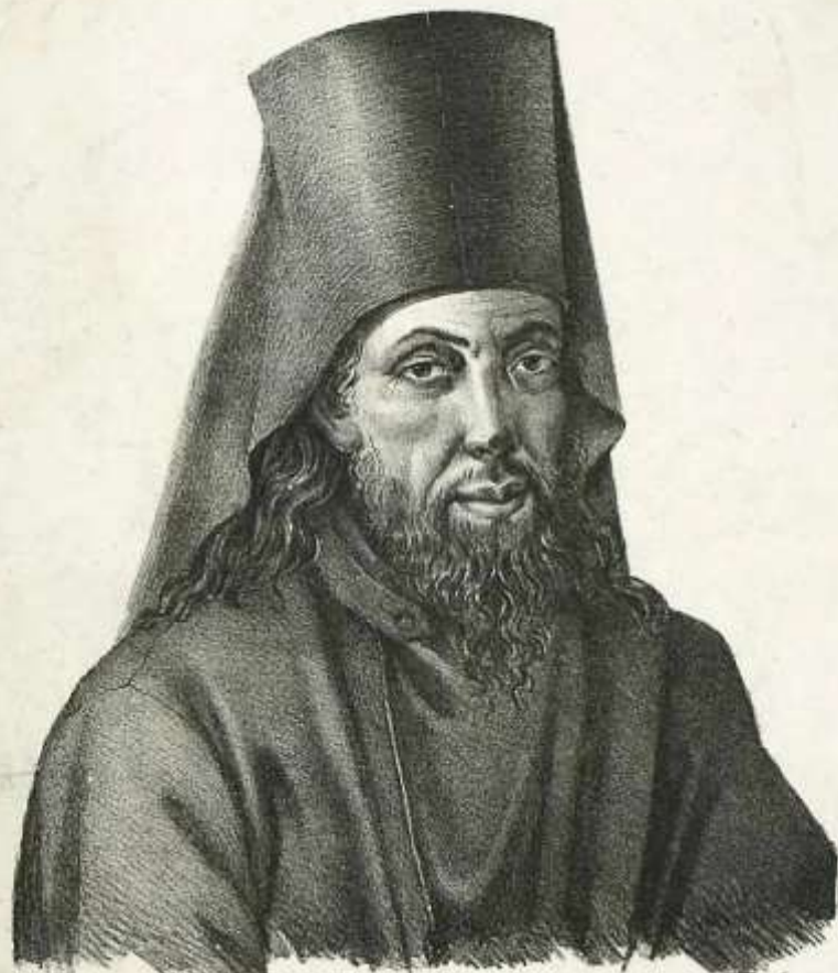
Рис. по миниатюре из кн. рукописей