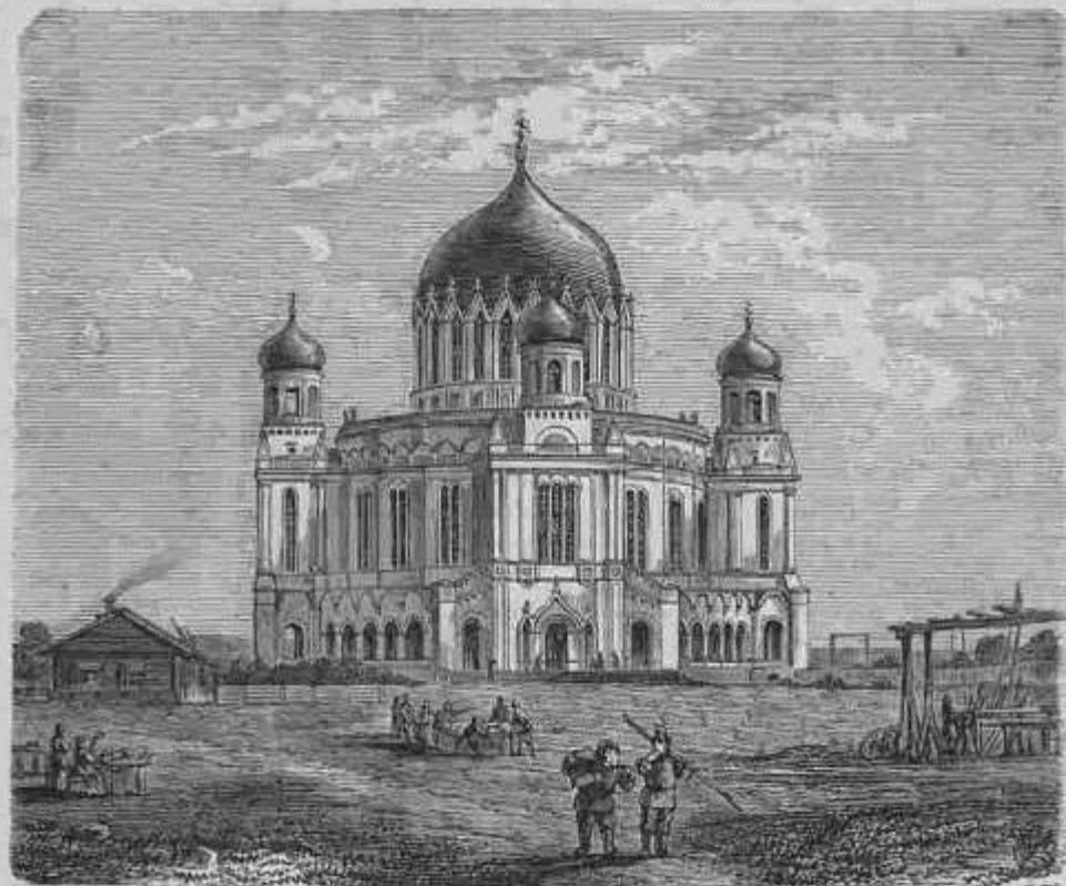
Витба: Александровский соборъ, построенный по плану архитектора Витберга. (Рисов. на дер. А. Кохучи, грав. Э. Даммиллеръ).